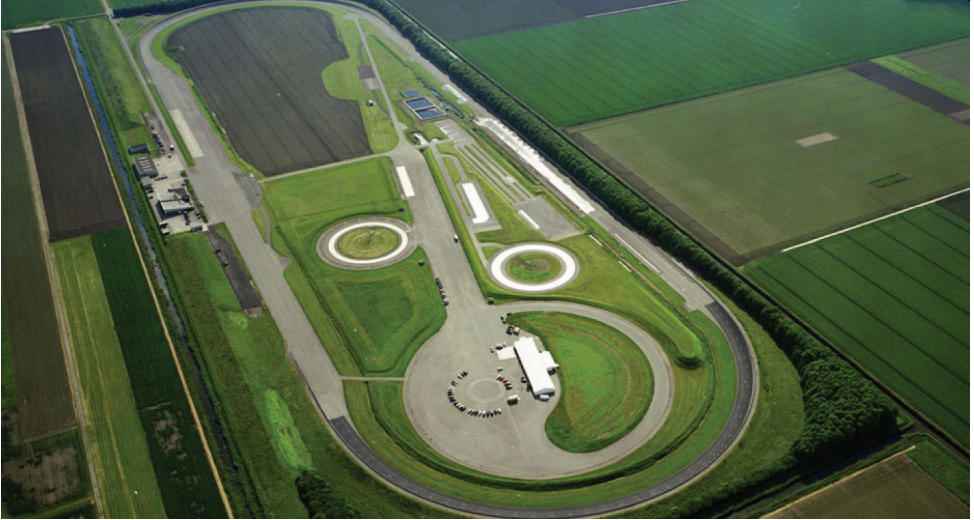
Luchtfoto RDW Test Centrum Lelystad